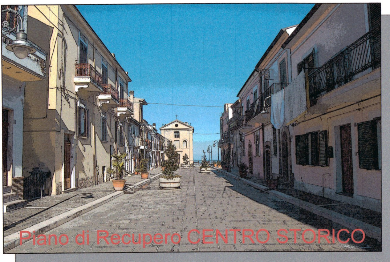
Piano di Recupero CENTRO STORICO

COMUNE DI SAN VITO CHIETINO (Provincia di Chieti)